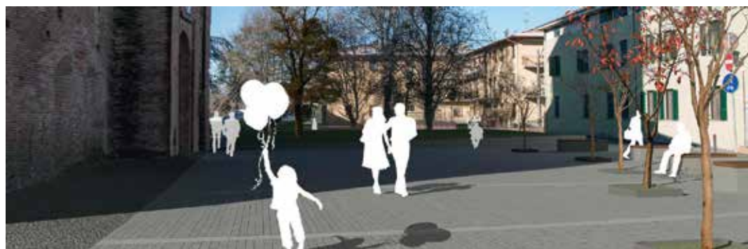
Piazza della Rocca

È stato redatto il progetto esecutivo per l'intervento finale di riparazione della Chiesa Collegiata di Santa Maria Maggiore, a seguito delle opere provvisorie di messa in sicurezza terminate alla fine del 2013. Dopo l'ok della Regione verrà scelta la ditta a cui saranno affidati i lavori. L'avvio del cantiere è previsto per l'autunno 2015. Maggiori informazioni ed aggiornamenti sono disponibili sul sito della Parrocchia all'indirizzo www.parrocchiapievedicento.it .