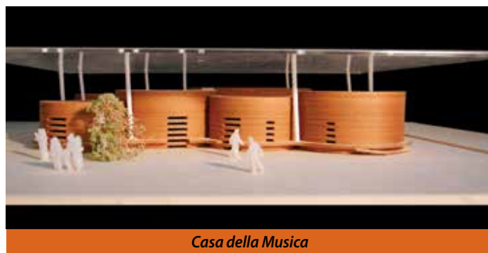
Casa della Musica

La scuola di Musica di Pieve di Cento è un progetto promosso e finanziato da Confindustria-CGIL-CISL-UIL e CONFSERVIZI che per l'occasione hanno costituito un TRUST chiamato "Nuova Polis", nato con la volontà di dare spazi e strutture alle due scuole di musica (Scuola di Musica moderna che conta oltre 180 allievi e la Scuola Media ad indirizzo musicale che conta 80 allievi) presenti nel Comune di Pieve. La Casa della musica sarà una piazza coperta di oltre 700 mq che ospiterà al suo interno le piccole aule musicali monostruamento, di forma circolare per facilitare la disposizione radiale degli allievi, comunicanti con una buffer zone con funzione bioclimatica e che serva al contempo da spazio distributivo e di sosta/wifi. La Casa della Musica si pone così l'obiettivo di fornire uno spazio fruibile in ogni momento della giornata, in grado di rappresentare un luogo di ritrovo e di aggregazione per la comunità, non soltanto in ambito musicale. L'intervento, posto nell'area verde antistante le scuole comunali medie, andrà a riqualificare un'area verde dando vita a una zona della città che fungerà da cintura urbana, creando un parco a servizio delle scuole, connesso con il circostante comparto urbanistico area Ex Lamborghini da una pista