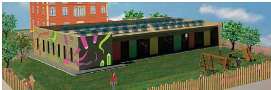
Asilo Nido Comunale

Il costo dell'intervento sulla Rocca è di 270.000€, interamente finanziato con Assicurazione. Il cantiere è partito nei primi giorni di Marzo per concludersi entro l'estate 2015.