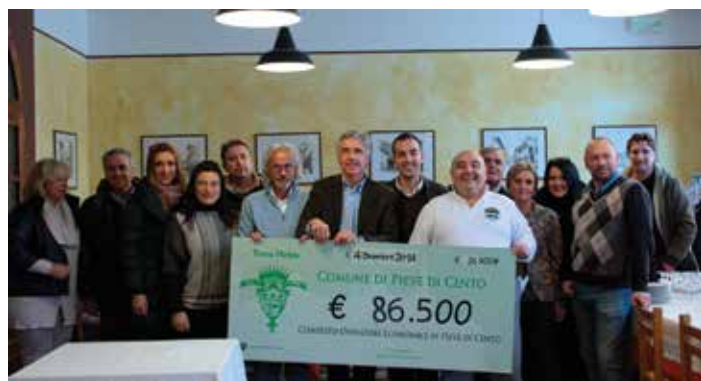
La consegna dell'assegno

In totale sono stati distribuiti 86.500 euro ad oltre n. 14 operatori economici di Pieve. Secondo il Sindaco Sergio Macagnani: "Ai commercianti che hanno presentato fatture per interventi fatti nel 2010 e parte del 2011 abbiamo consegnato oltre