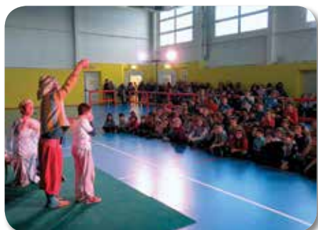
Spettacolo di FunScience presso la Palestra comunale per i tutti i bambini

La festa si è conclusa nella nostra Piazza Andrea Costa, assistendo allo spettacolare concerto della sorprendente Banda "Rulli Frulli". L'appuntamento è a febbraio 2017, nel frattempo però bisogna...pedalare! ■