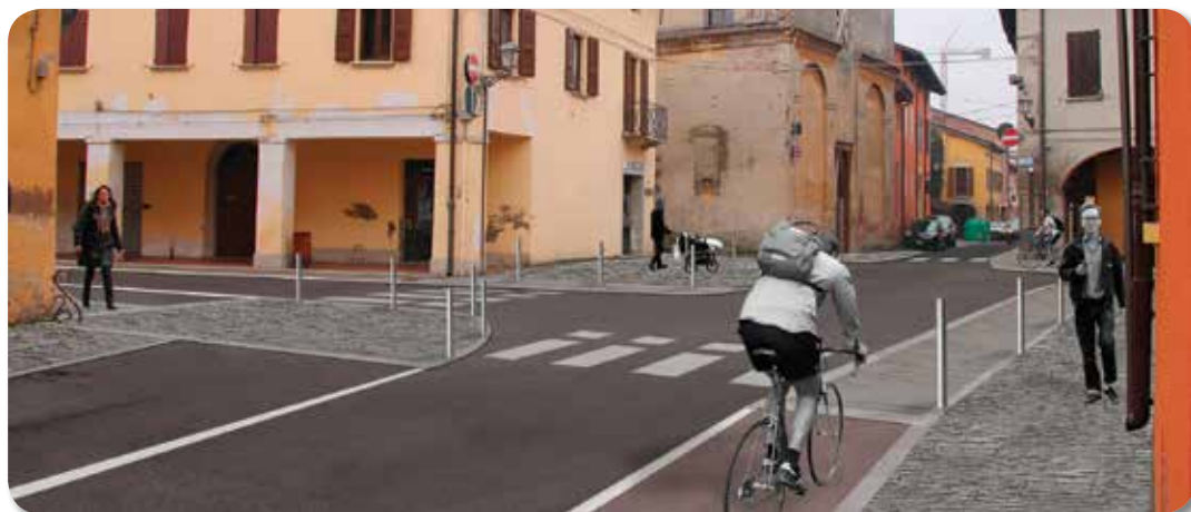
Via San Carlo