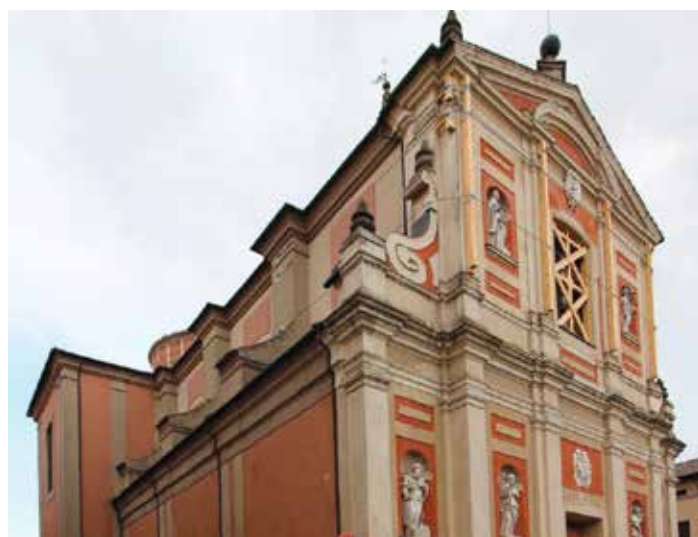
Collegiata Santa Maria Maggiore

Le opere di restauro comportano il rifacimento dei due bagni esistenti adeguandoli alle normative vigenti in termini di superamento delle barriere architettoniche, e