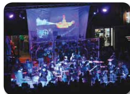
Concerto della Banda Rulli Frulli in Piazza A. Costa