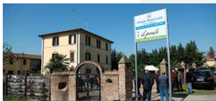
Il Ponte - edificio confiscato e riconvertito in struttura d'accoglienza e sede della Polizia Municipale

Per questo motivo Pieve è stata scelta sede di questo convegno