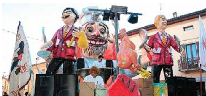
Il carro vincitore