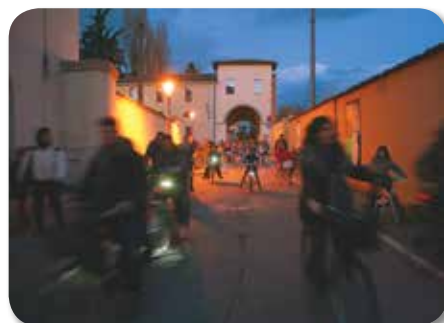
Arrivo della bicicletтата in Piazza A. Costa