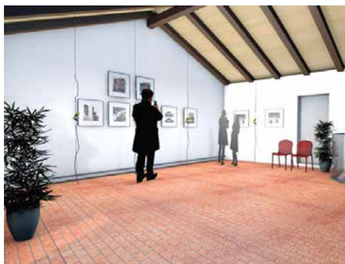
L'interno di Porta Cento

la sanificazione delle murature dalla umidità abbondantemente presente. Al termine dei lavori l'edificio verrà ritinteggiato internamente ed esternamente. Il costo dei lavori ammonta a 175.000 Euro circa di cui 74.901,45 finanziati dalla Regione ed il rimanente con rimborso assicurativo. Il cantiere partirà entro l'estate 2016.