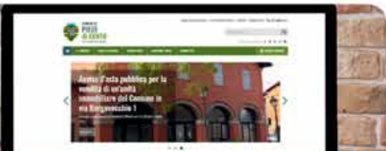
RINNOVO SITO WEB COMUNE