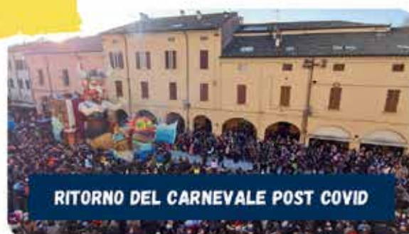
RITORNO DEL CARNEVALE POST COVID