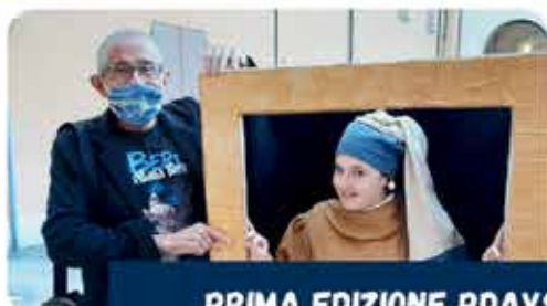
PRIMA EDIZIONE PDAYS