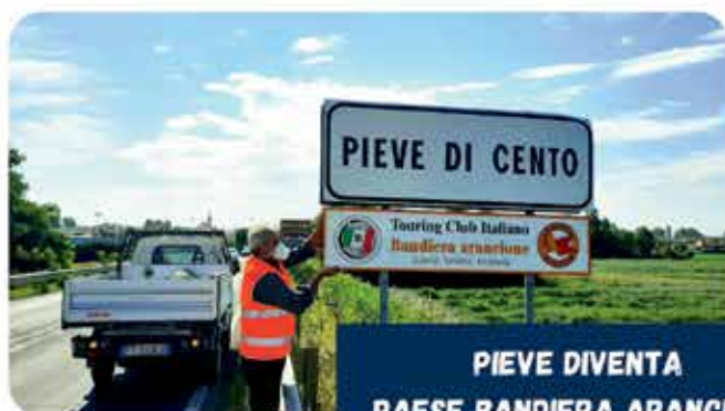
PIEVE DIVENTA PAESE BANDIERA ARANCIONE DEL TOURING CLUB