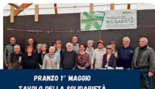
PRANZO 1° MAGGIO TAVOLO DELLA SOLIDARIETÀ