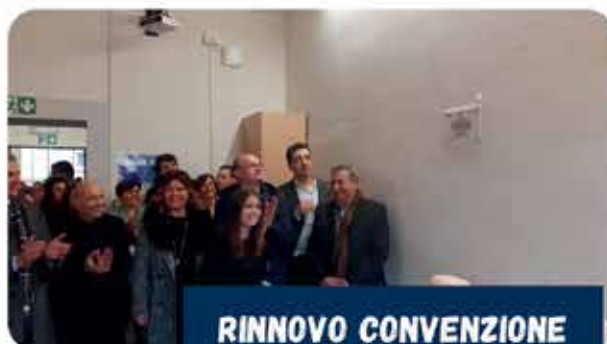
RINNOVO CONVENZIONE CORSO INFERMIERISTICA