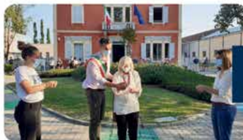
INAUGURAZIONE GIARDINO LAB63