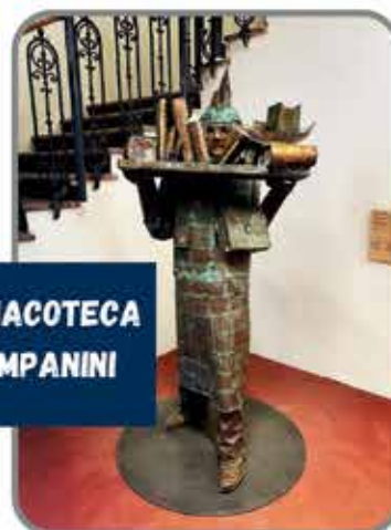
INTITOLAZIONE PINACOTECA A GRAZIANO CAMPANINI