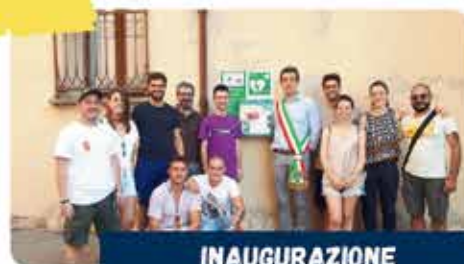
INAUGURAZIONE DEFIBRILLATORE IN PIAZZA ANDREA COSTA