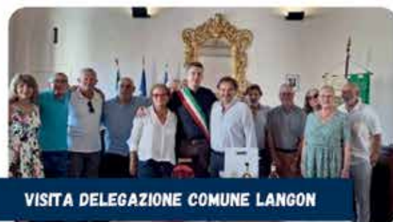
VISITA DELEGAZIONE COMUNE LANGON