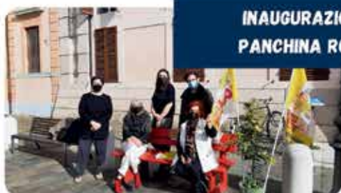
INAUGURAZIONE PANCHINA ROSSA