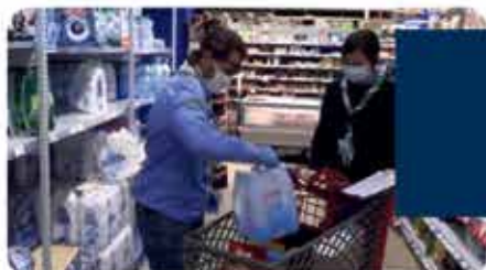
GESTIONE EMERGENZA COVID