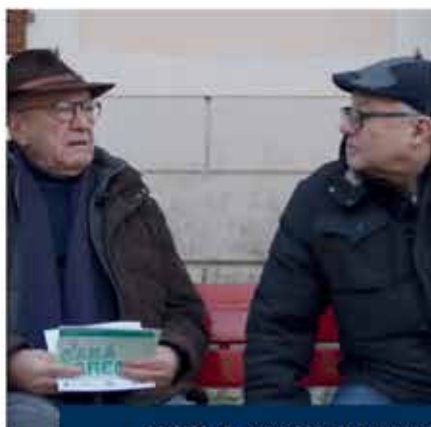
AVVIO E ACCOMPAGNAMENTO MODIFICHE RACCOLTA RIFIUTI