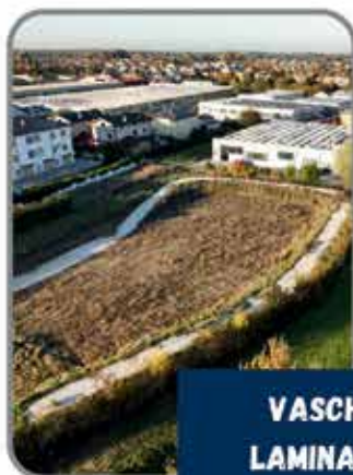
VASCHE DI LAMINAZIONE