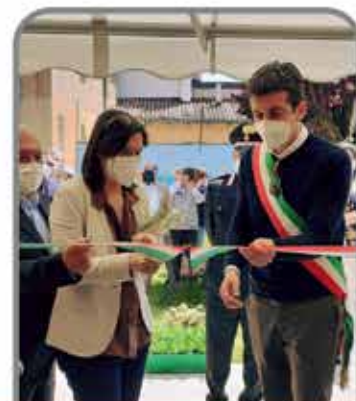
INAUGURAZIONE CENTRO DIURNO ASP