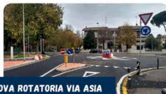
NUOVA ROTATORIA VIA ASIA