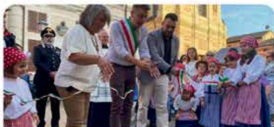
RILANCIO FIERA DI PIEVE POST COVID