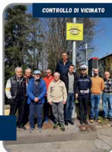
CONTROLLO DI VICINATO