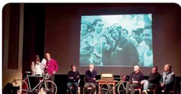
INAUGURAZIONE MOSTRA SU FAUSTO COPPI