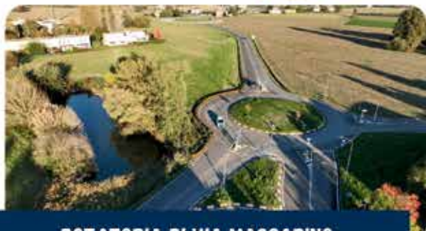
ROTATORIA DI VIA MASCARINO