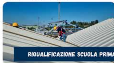
RIQUALIFICAZIONE SCUOLA PRIMARIA