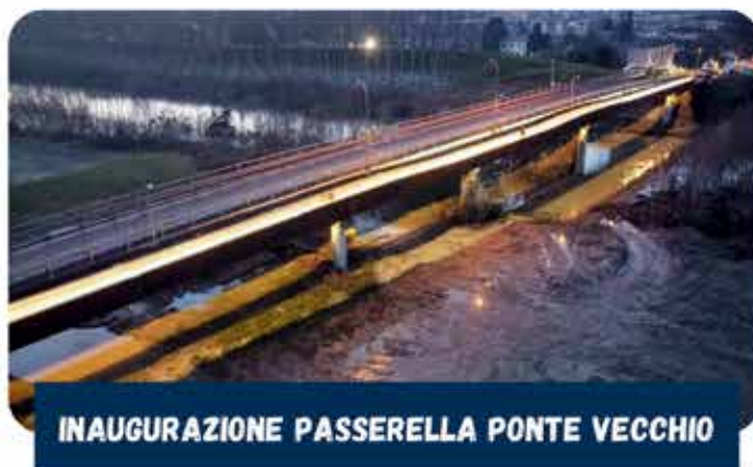
INAUGURAZIONE PASSERELLA PONTE VECCHIO