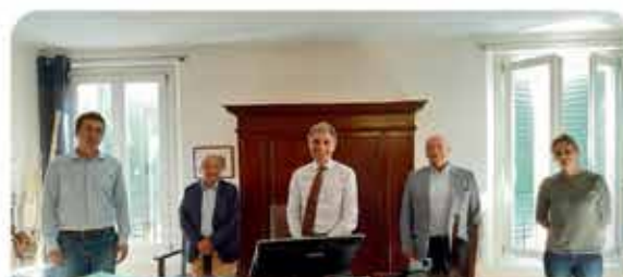
ACQUISIZIONE EX CHIESA DEGLI SCOLOPI