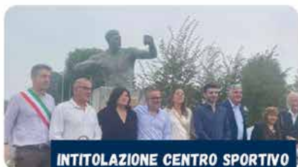
INTITOLAZIONE CENTRO SPORTIVO A FRANCESCO CAVICCHI