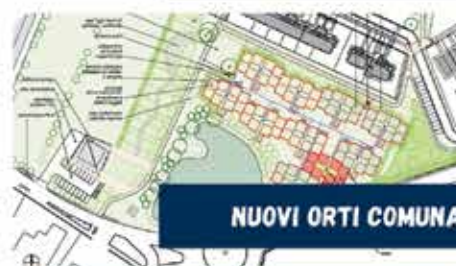
NUOVI ORTI COMUNALI