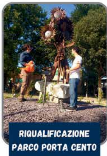
RIQUALIFICAZIONE PARCO PORTA CENTO