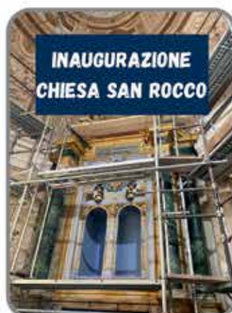
INAUGURAZIONE CHIESA SAN ROCCO