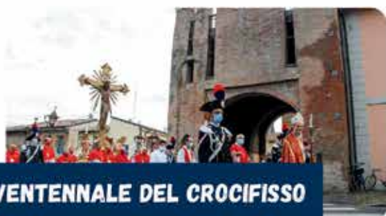
VENTENNALE DEL CROCIFISSO