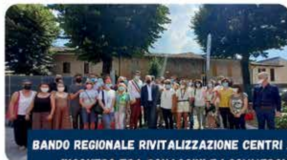
BANDO REGIONALE RIVITALIZZAZIONE CENTRI STORICI – INCONTRO TRA BONACCINI E I COMMERCianti