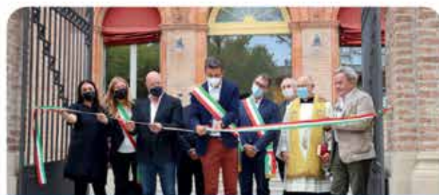
INAUGURAZIONE BIBLIOTECA-PINACOTECA "LE SCUOLE"