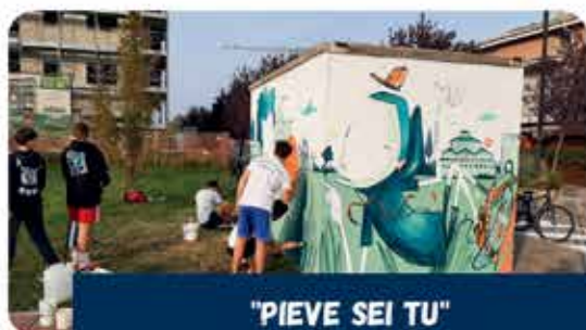
"PIEVE SEI TU" PROGETTO DI EDUCATIVA DI STRADA