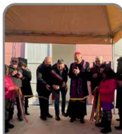
INAUGURAZIONE EMPORIO SOLIDALE