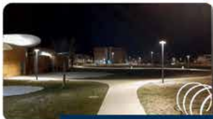
NUOVA ILLUMINAZIONE PUBBLICA