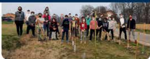
PIANTUMAZIONE NUOVI ALBERI