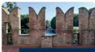
RISTRUTTURAZIONE PORTA FERRARA