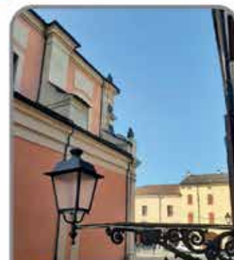
EFFICIENTAMENTO ILLUMINAZIONE CENTRO STORICO