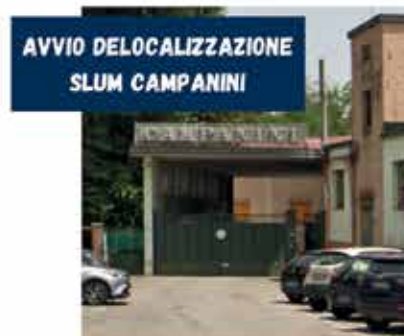
AVVIO DELOCALIZZAZIONE SLUM CAMPANINI