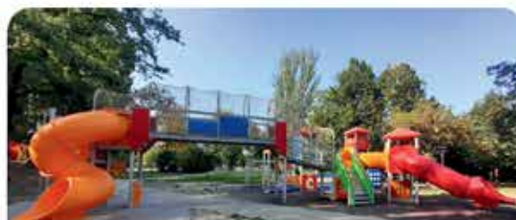
INAUGURAZIONE NUOVO GIOCO CASTELLO