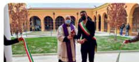
INAUGURAZIONE GIARDINO DEDICATO AL "MILITE IGNOTO E AI CADUTI CIVILI DI TUTTE LE GUERRE"