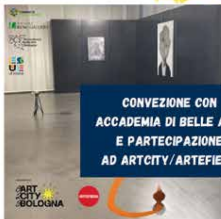
CONVEZIONE CON ACCADEMIA DI BELLE ARTI E PARTECIPAZIONE AD ARTCITY/ARTEFIERA