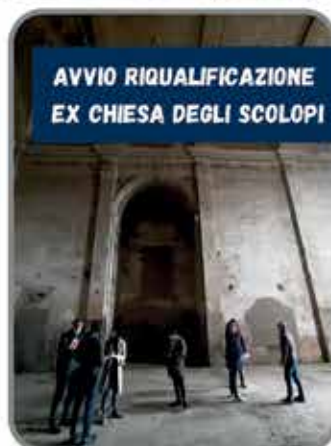
AVVIO RIQUALIFICAZIONE EX CHIESA DEGLI SCOLOPI