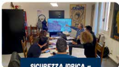
SICUREZZA IDRICA – GESTIONE EMERGENZE