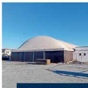
INAUGURAZIONE SALA POLIVALENTE

Grazie a tutte e tutti coloro che hanno reso possibile questo viaggio!