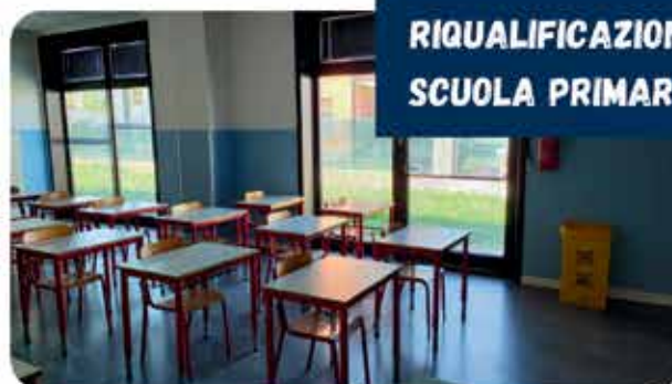
RIQUALIFICAZIONE SCUOLA PRIMARIA