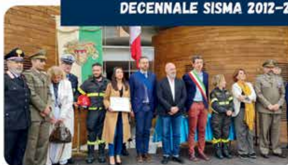
DECENNALE SISMA 2012-2022