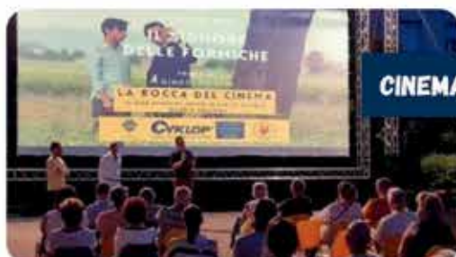
CINEMA IN ROCCA