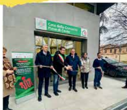
INAUGURAZIONE CASA DELLA SALUTE