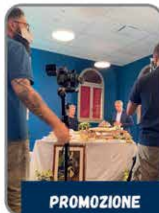
PROMOZIONE PRODOTTI GASTRONOMICI PIEVESI