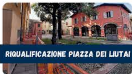
RIQUALIFICAZIONE PIAZZA DEI LIUTAI