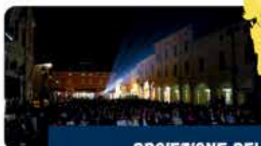
PROIEZIONE DEL FILM "MIO FRATELLO RINCORRE I DINOSAURI"