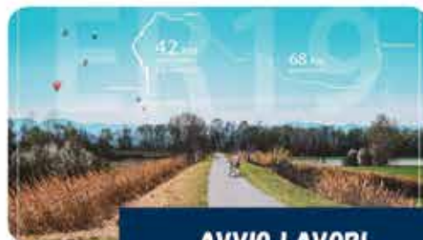
AVVIO LAVORI CICLOVIA DEL RENO