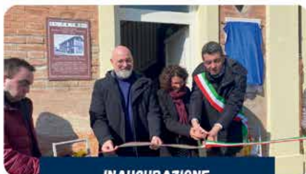
INAUGURAZIONE “ALLA STAZIONE” E CENTRO PER LE FAMIGLIE