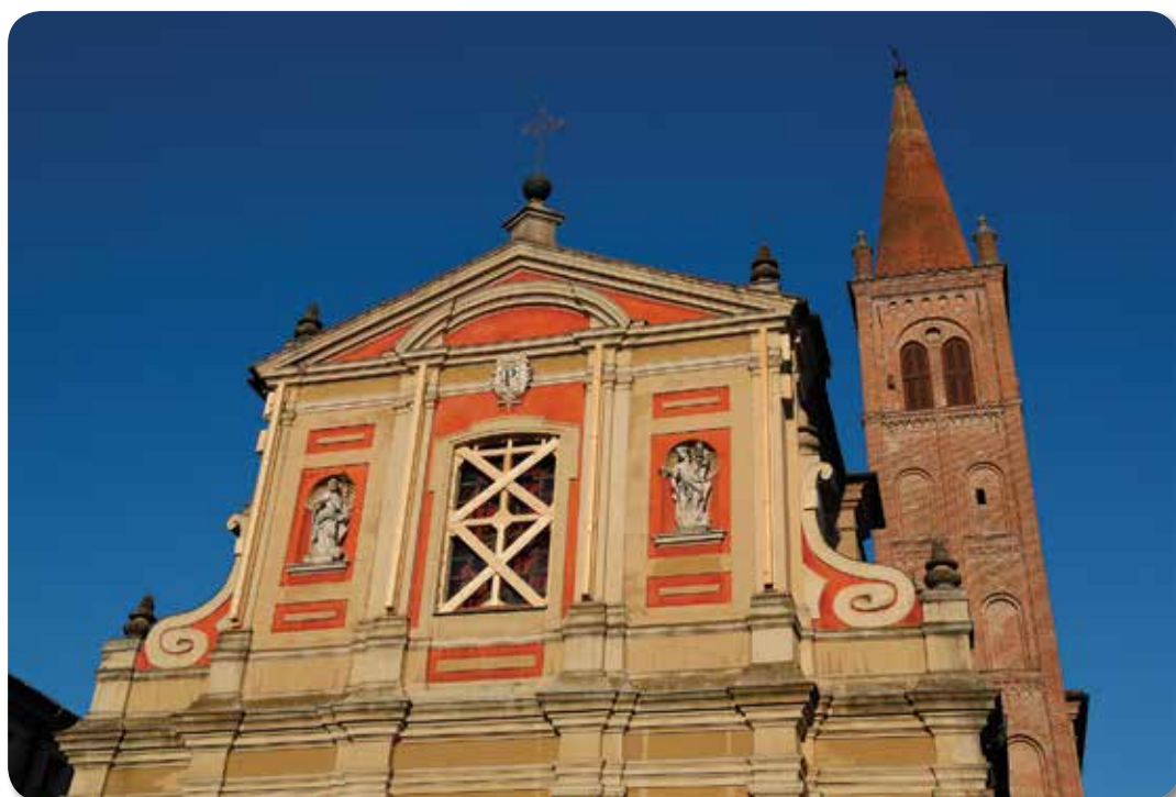
Chiesa Collegiata di Santa Maria Maggiore