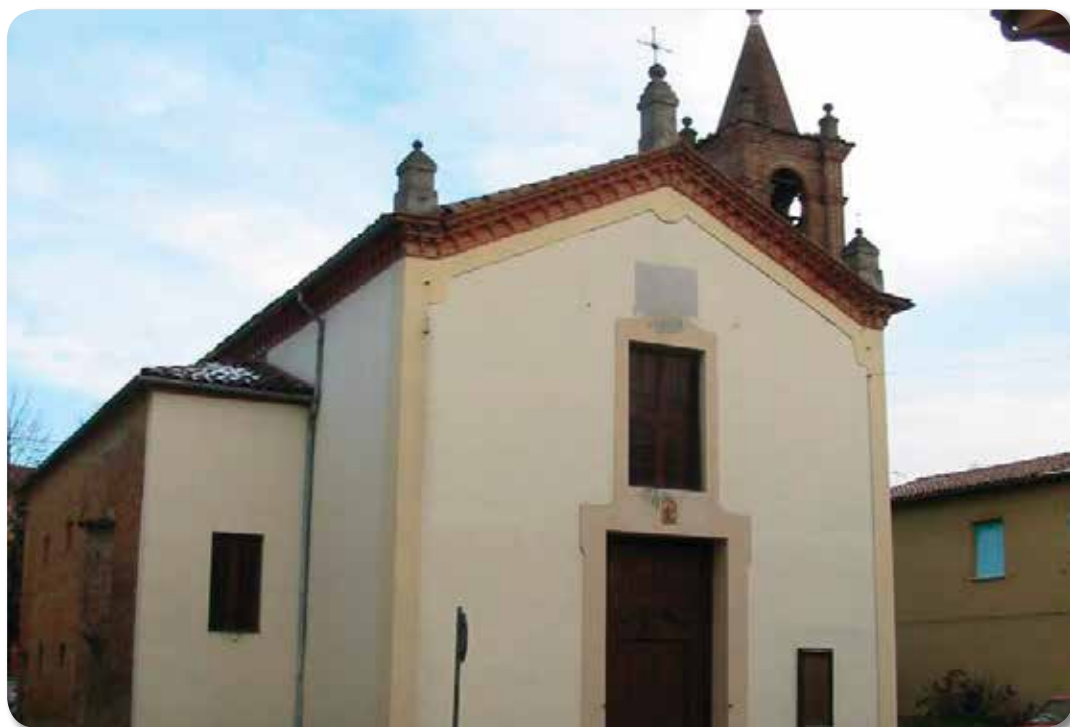
Chiesa della SS. Trinità