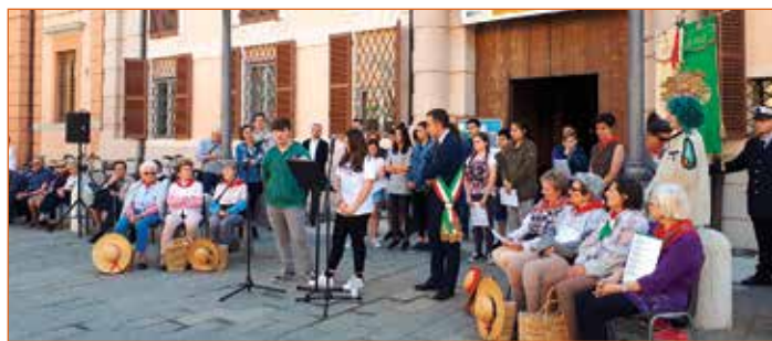
I ragazzi della Classe 3ªA

mossa da Nedda Po Alberghini sul 25 Aprile "...E fu Resistenza" , un progetto a fumetti frutto di una ricerca realizzata nel 1984 dalla classe 3ªA della Scuola Media "A.Gessi" di Pieve di Cento che racconta in maniera puntuale, attraverso gli occhi e le parole dei giovani che furono suoi studenti nel 1984, che cosa fu la Resistenza anche a Pieve, sul nostro territorio. ■