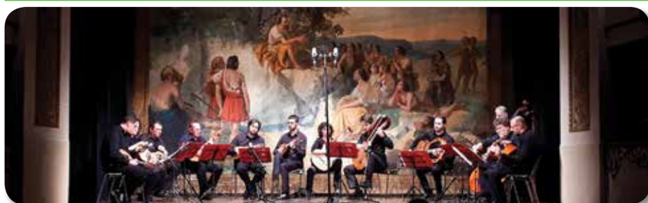
L'esibizione dell'Orchestra Caput Gauri