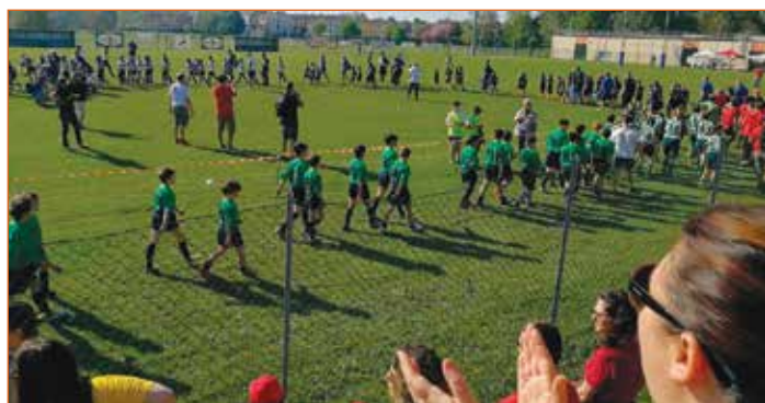
L'ingresso delle squadre

nanza pievese e non solo, grazie anche alla presenza delle associazioni benefiche del territorio, tra cui la protagonista Fondazione ANT a cui è stato devoluto parte del ricavato per sostenere le attività della Residenza Giuseppina Melloni. La disciplina del rugby si conferma ancora una volta un pilastro dell'aggregazione e del fair play, come buona e sana pratica sportiva da far praticare ai propri figli! ■