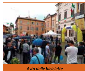
Asta delle biciclette