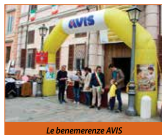
Le benemerite AVIS