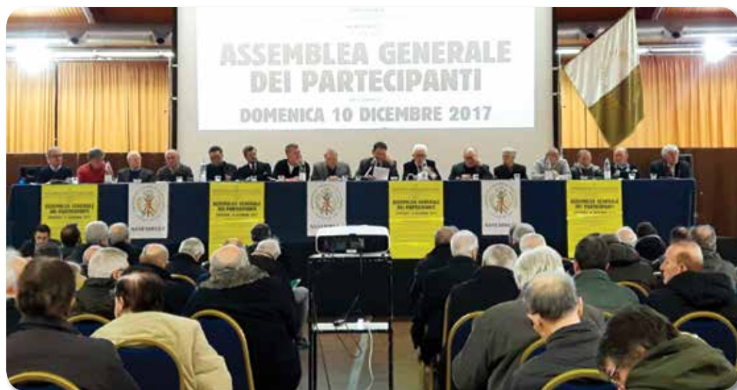
Assemblea generale Partecipanza Agraria

Il nostro Ente che comprende aventi diritto abitanti di Pieve, Renazzo e Dodici Morelli, è pro-