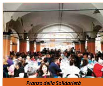
Pranzo della Solidarietà