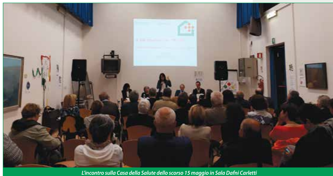
L'incontro sulla Casa della Salute dello scorso 15 maggio in Sala Dafni Carletti

rivo di un nuovo medico. Importante il potenziamento di alcuni tra i servizi già presenti presso il poliambulatorio, nello specifico diabetologia, cardiologia e dietetica di base, che aumentano significativamente le presenze.