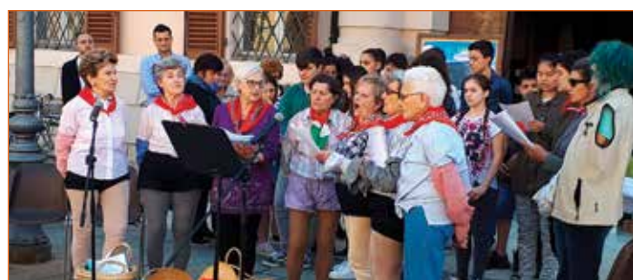
Il Coro delle mondine di Bentivoglio