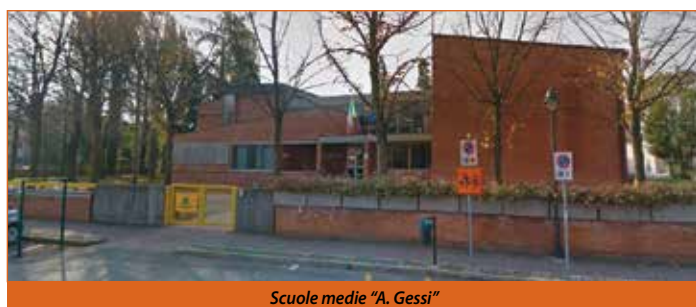
Scuole medie "A. Gessi"

Abbiamo così, sulla base di queste condizioni, approvato il progetto esecutivo e in questi giorni si stanno completando le procedure di affidamento dei lavori. Il cantiere