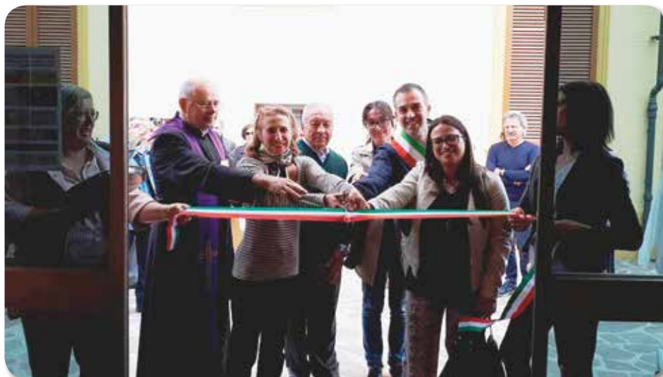
Inaugurazione Punto di Ascolto e Aggregazione dei Volontari di Fondazione ANT

Info: 0510939123 - centromelloni@ant.it delegazione.pieve@ant.it ■