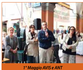
1° Maggio AVIS e ANT

L'Amministrazione ringrazia i volontari che si sono messi al lavoro già nei mesi precedenti per garantire, ancora una volta, una manifestazione di successo per ricordarci che uniti si può fare molto, per sé e per gli altri! ■