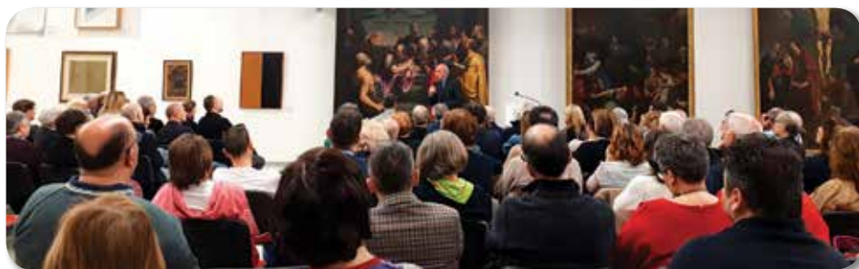
La lectio magistralis di Luigi Ficacci

Tante le iniziative che hanno animato i nostri Musei e contenitori culturali. Importante la partecipazione dei cittadini di Pieve e del territorio della Città Metropolitana di Bologna. Molte le attività volte a far conoscere la nostra storia e le storie connesse al nostro patrimonio: dalla lectio magistralis di Luigi Ficacci sull' "Assunta" di Guido Reni alla lezione della Professoressa Vera Fortunati nella Chiesa della Santissima Trinità sul nostro patrimonio custodito in Pinacoteca. Ma i week end dell'arte a Pieve sono stati anche l'occasione per sentire tanta musica -dal concerto delle ocarine di Budrio all'esibizione dell'Orchestra Caput Gauri con le chitarre custodite presso il nostro Museo della Musica, fino alle giovani Le Scat Noir nell'oratorio affrescato della Santissima Trinità- e per vedere in anteprima uno spettacolo meraviglioso dedicato alle parole di Roberto Roversi, prodotto all'interno della stagione teatrale Agorà. Con la seconda edizione dei week end dell'arte, il Comune di Pieve sta proseguendo nella strada di impegnarsi nel settore culturale non solo come possibile motore di sviluppo economico , ma anche come fattore in grado di farci conoscere ancora di più la storia delle nostre origini, di ripensare il nostro futuro, di fare ed essere più comunità! ■