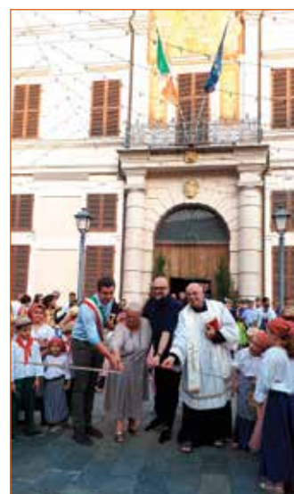
Taglio del nastro

Tre giorni ricchissimi di appuntamenti, un'occasione unica di