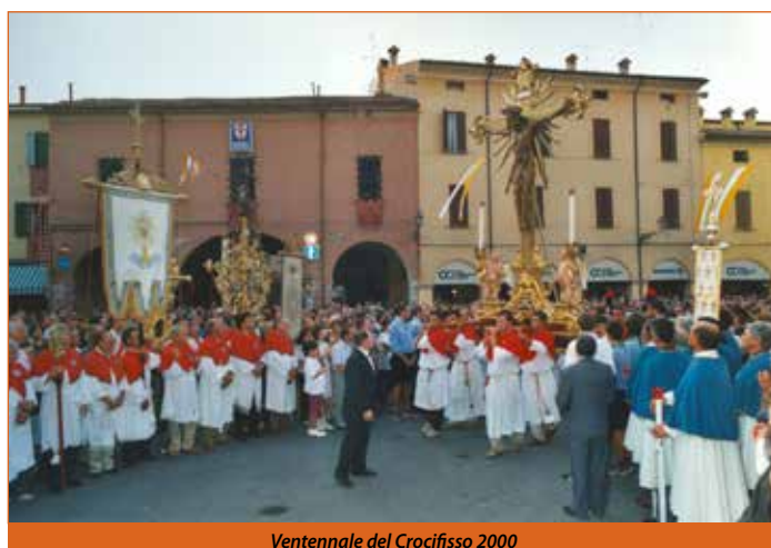
Ventennale del Crocifisso 2000

14 al 19 settembre le Sante Messe, ogni giorno presiedute da Vescovi, e dedicate a pellegrinaggi dei fedeli delle Parrocchie dei Vicariati di Cento, Galliera e San Giovanni in Persiceto che da secoli sono particolarmente devoti al nostro Crocifisso. Ma dobbiamo segnalare la necessità di prenotazione per tutti gli eventi sia religiosi che culturali per il rispetto delle regole, in particolare per partecipare alla Santa Messa in Piazza celebrata dal nostro arcivescovo Cardinale Matteo Zuppi, domenica 20 settembre alle ore 18. Per quanto riguarda la Processione le regole impongono dei vincoli e sarà presente solo una rappresentanza di fedeli. Informiamo inoltre che il Crocifisso, accompagnato su un mezzo dei Vigili del Fuoco, attraverserà numerose strade di Pieve e raggiungerà tutte le quattro Porte da dove il Cardinale impartirà la Benedizione. Si ricorda ai cittadini che il Programma si