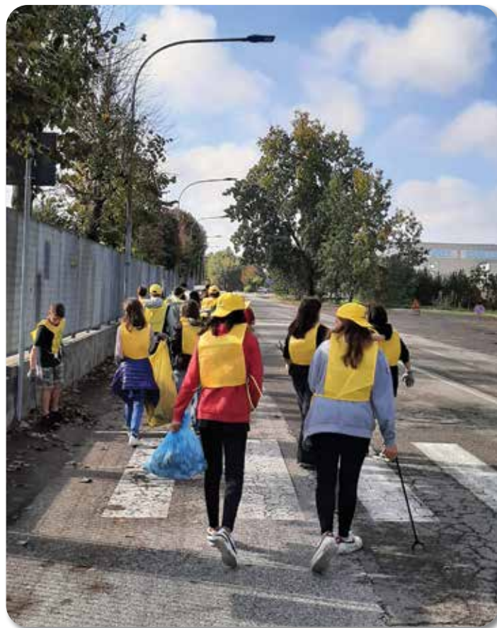
Puliamo il Mondo 2022

Per questo stiamo cercando con tutte le nostre forze di ordinare bene quelle che secondo noi devono essere le priorità. Da un lato ci sono alcune attenzioni che dobbiamo avere ancora di più e azioni nuove che dobbiamo mettere in campo per far fronte a questa emergenza in termini finanziari: dobbiamo mettere in sicurezza i conti del nostro Bilancio cercando tutte le soluzioni possibili in termini di risparmi, rine-