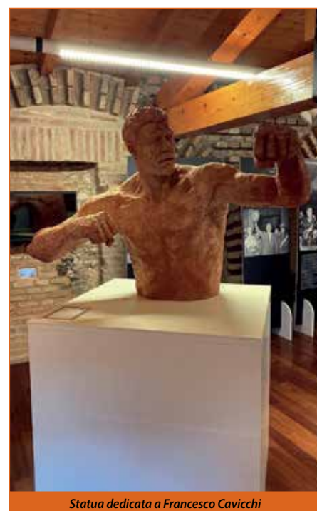
Statua dedicata a Francesco Cavicchi