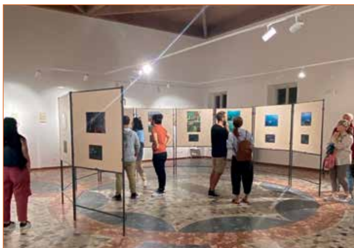
Inaugurazione mostra fotografica Quaderni di Viaggio