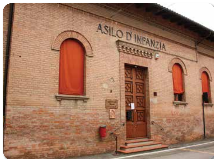
Centro Sociale Luigèn

Noi del comitato vorremmo che tutte le persone di Pieve, e se non tutte quasi, venissero al Centro dove sarebbero ben accolti. "Cari cittadini pievesi, voi forse non sapete che il centro vi ama? Veniteci a trovare, grazie!" ■