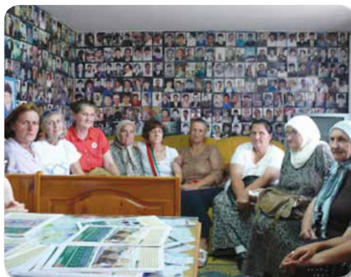
Casa dell'associazione "Zene Srebrenica" a Tuzla

È stato un viaggio importante, emozionante e significativo. Abbiamo visitato i luoghi simbolo della tragedia e il Memorial Center a Potocari, depositando in ognuno di questi un mazzo di fiori a loro ricordo e memoria. A Tuzla abbiamo incontrato "Le Donne di Srebrenica" e dalla loro Casa, donata dall'Associazione Le Case degli Angeli di Daniele nel 2010, diventata Centro di Documentazione, l'11 giugno siamo partiti per formare il corteo della Protesta, un rito che da venti anni si ripete l'11 di ogni mese: un corteo senza voci, senza urla, senza clamore ma pieno di sguardi tristi e decisi, di solidarietà, di condivisione, di autenticità, di forza, di coraggio tutto nel più dignitoso silenzio. Un pensiero particolare lo voglio offrire a queste donne che ho avuto la fortuna di conoscere. Sui loro volti ho visto dolore e sofferenza