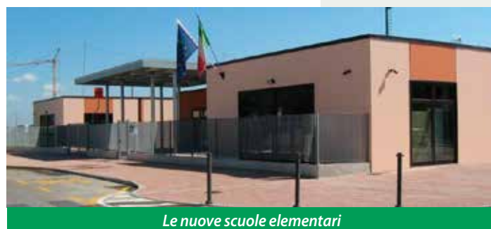
Le nuove scuole elementari

Partiamo dall'asilo nido: a Pieve sono stati accolti quest'anno tutti i bambini in graduatoria che hanno presentato domanda entro i termini ,