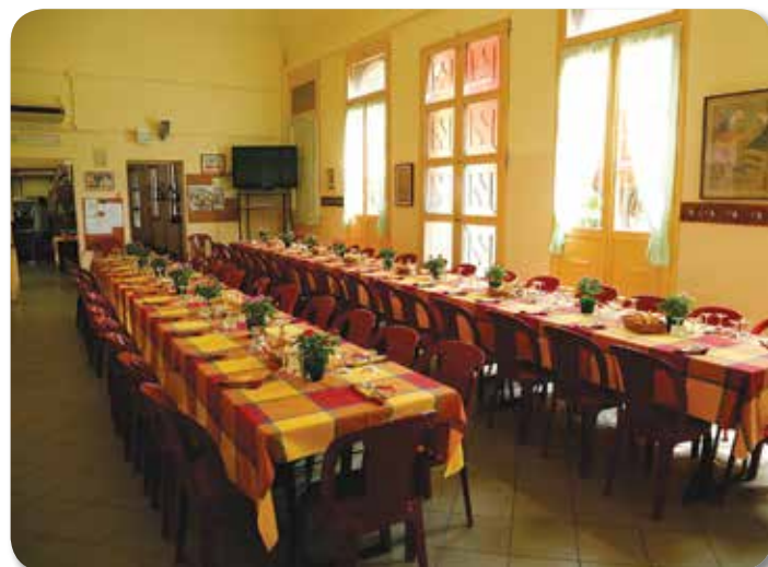
Pranzo di Ferragosto