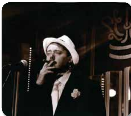
Fanny & Alexander Kriminal Tango

A Pieve di Cento si esibiranno artisti tra i più importanti della scena contemporanea con spettacoli da non perdere: da rivisitazioni in chiave pop dei classici shakespeariani a temi di grande attualità come quello della famiglia, del gioco d'azzardo, della relazione tra generazioni fino a