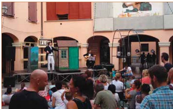
I musicanti di Brema - Flux