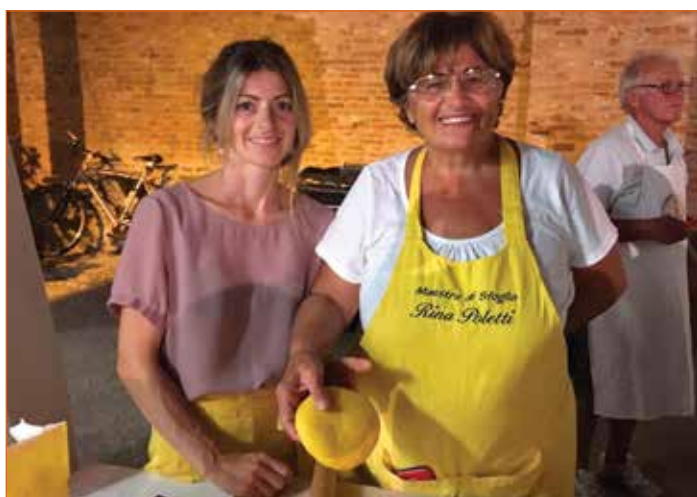
A scuola di sfoglia

Piazza Partecipanza è stata la nuova sede, della 7° edizione del festival di arti e musica "Flux in Movement" dell'Associazione culturale Flux, che ha visto sul palco band, artisti solisti, dj di fama nazionale oltre alla compagnia teatrale Teatro Perdavvero che ha coinvolto grandi e piccoli con lo spettacolo "I Musicanti di Brema".