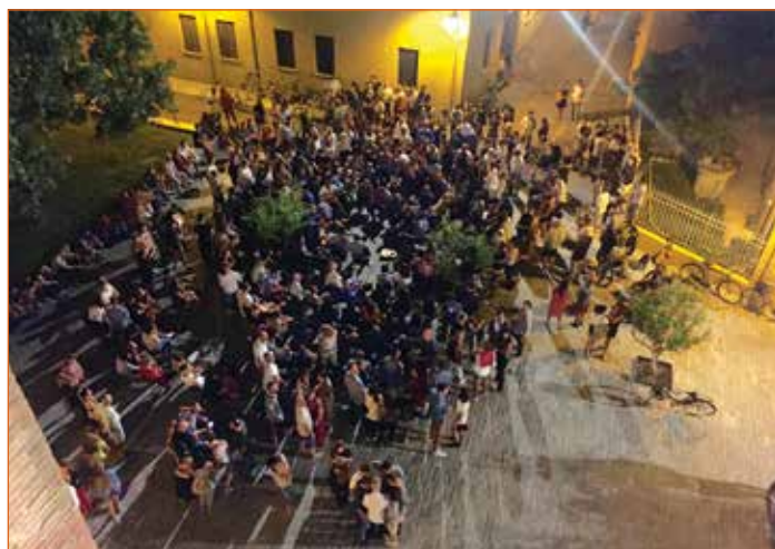
Ragazzi in Piazza della Rocca