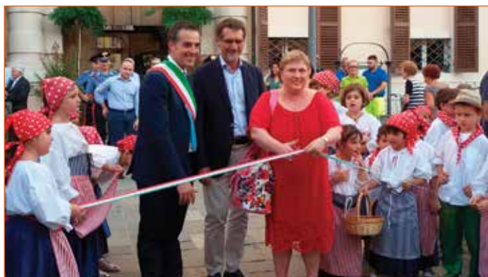
L'inaugurazione della Fiera