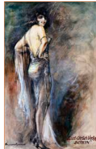
Belle Epoque - illustrazione di Ludwig Lutz Eheremberger

Appuntamento per l' inaugurazione sabato 5 novembre alle 17.00 , a seguito della presentazione con i critici ed i curatori, la visita della mostra sarà animata da musiche e danze dell'epoca. ■