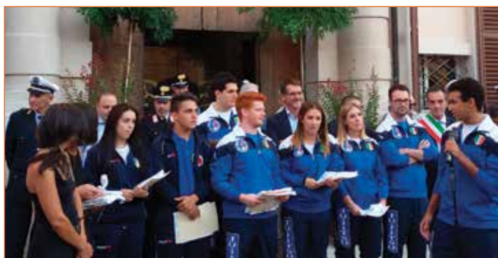
Gli atleti dello Shinsen Ju Jitsu