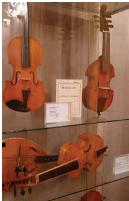
Viole da gamba esposte al Museo della Musica

Il Sindaco e l'Amministrazione Comunale esprimono alla Fondazione CaRiCento un caloroso ringraziamento per questo, ulteriore, atto di generosità manifestato nei confronti della comunità. ■