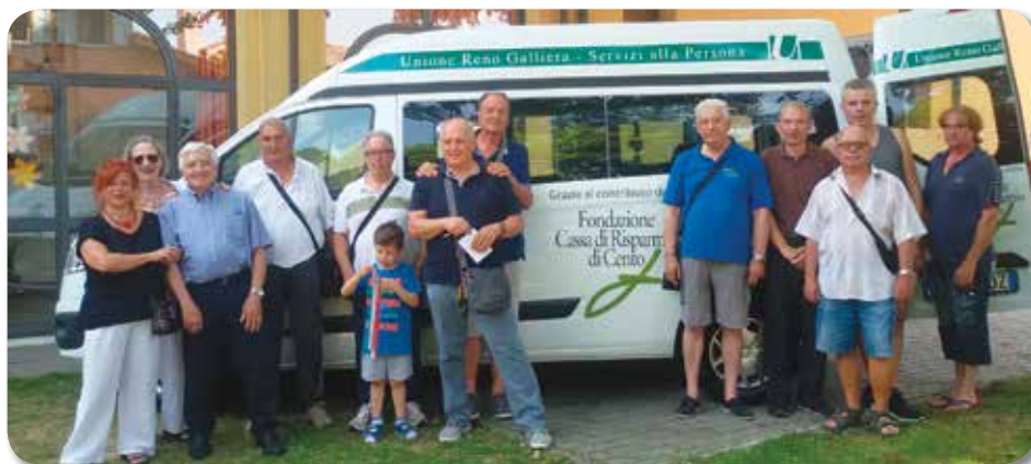
I volontari AUSER

D a più di vent'anni l'Associazione AUSER offre alla nostra comunità un'ampia varietà di servizi fondamentali: trasporta anziani e bisognosi presso le strutture sanitarie per visite ed esami, accompagna disabili presso le strutture diurne ricreative, fornisce supporto ai servizi della Casa della Salute (CUP e consegna ricette mediche), coordina assieme all'Ausl il progetto Mai più soli presso il Centro sociale Luigén, garantisce la presenza sei di volontari presso l'ASP Galuppi Ramponi (ex Opera Pia Galuppi) per l'accompagnamento degli utenti che frequentano il centro diurno, e il servizio di biancheria e farmacia. È inoltre da sempre di supporto al Comune per le attività e gli eventi rivolti alla cittadinanza, con l'apertura della Sala Partecipanza, e l'accompagnamento dei bambini che frequentano lo scuolabus o vanno a scuola con il progetto Piedibus. Vi basti sapere che con i mezzi di trasporto a disposizione i volontari percorrono oltre 120mila chilometri all'anno! Con la fine dell'estate le attività ed i servizi offerti da AUSER riprenderanno a pieno regime, tutti portati avanti da una trentina di volontari attivi giornalmente su una sessantina di tesserati.