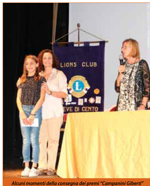
Alcuni momenti della consegna dei premi "Campanini Giberti"