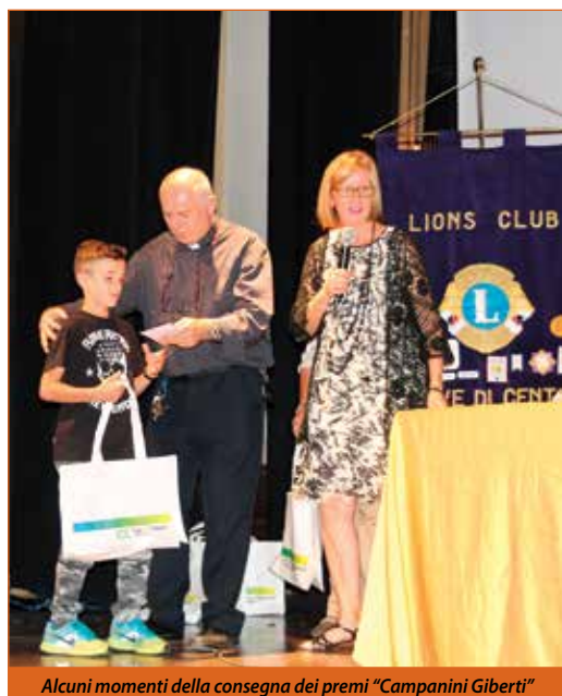
Alcuni momenti della consegna dei premi "Campanini Giberti"

Gli eventi a marchio Lions Club di Pieve di Cento non finiscono certo qui: con la riapertura del Teatro Alice Zeppilli sono previsti spettacoli il cui incasso andrà in beneficenza -la prima data in programma è venerdì 13 ottobre con "Figli si nasce", della compagnia Il Teatro del Reno- ed altre iniziative aperte alla cittadinanza, volte all'arricchimento dei servizi rivolti alla comunità locale e alla sua valorizzazione. ■