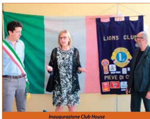
Inaugurazione Club House