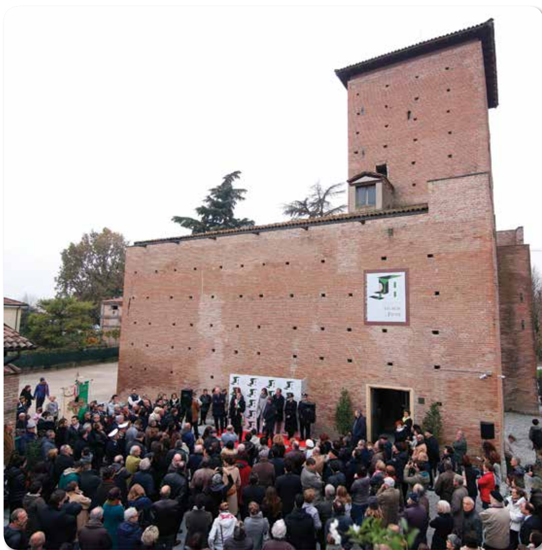
Inaugurazione Museo delle storie di Pieve - 14 novembre 2015

A livello locale penso che il nostro impegno debba essere massimo. Nella diffusione di una cultura di pace, nella costruzione di un processo di integrazione che non può essere strumentalizzato dall'azione brutale di cellule e movimenti terroristici. E soprattutto credo sia opportuno non abbassare la guardia sulla promozione della cultura. La cultura come elemento in grado di garantire il futuro del nostro territorio, la cultura come obiettivo sui quali lavorare, con e per le giovani generazioni. In questo senso nelle settimane scorse abbiamo inaugurato il nuovo Museo delle Storie di Pieve , ubicato nei locali di Porta Bologna e della Rocca completamente riqualificate dopo il sisma del 2012 e inserito in una nuova piazza realizzata dopo un concorso di progettazione svoltosi nel 2012.