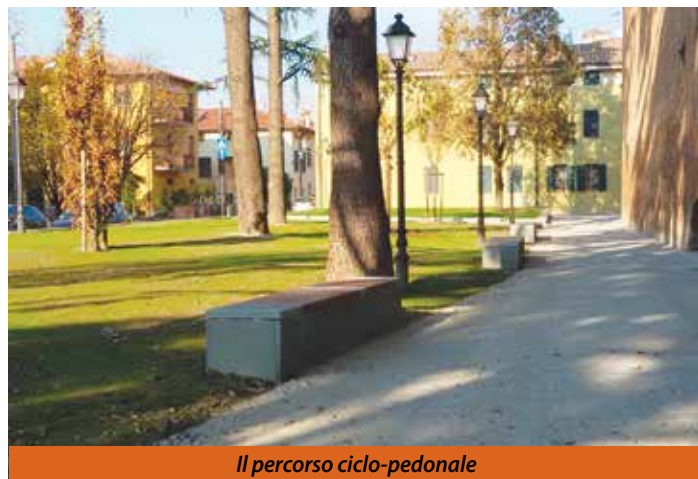
Il percorso ciclo-pedonale