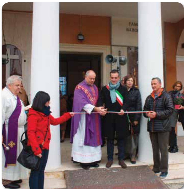
L'inaugurazione del 2 novembre scorso