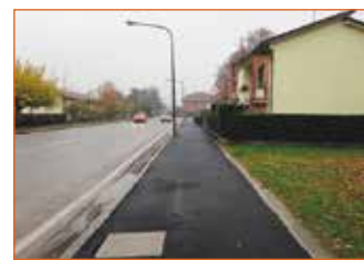
Circ. Levante - marciapiedi

Infine sono stati realizzati quattro nuovi attraversamenti pedonali rialzati (due in via Asia e due in via Cento) per obbligare le auto ad andare piano lungo strade in cui - prima - "correvano" davvero troppo! Tutto questo ha comportato una spesa di oltre 400.000 euro, di cui una parte (per via Matteotti) finanziata dalla Regione Emilia Romagna. E' stato un grande sforzo economico e sono stati lavori che, in alcuni casi, hanno comportato disagi, ma tutto è stato fatto con l'unico intento di dare a Pieve strade