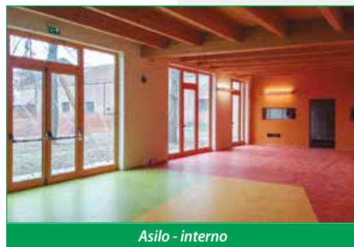
Asilo - interno