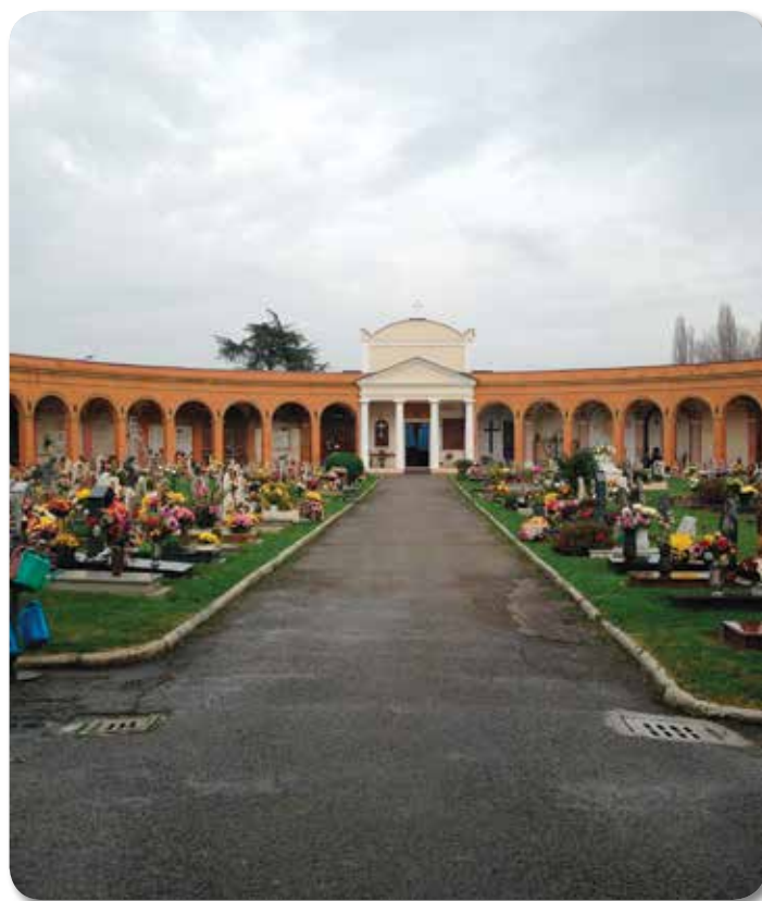
Cimitero - Il campo

L'investimento sul cimitero rientra nell'ambito degli interventi volti a fare Pieve + bella di prima e nel corso del 2017 si lavorerà per prevedere l'ampliamento dello stesso al fine di dare una risposta positiva alle esigenze delle famiglie. ■