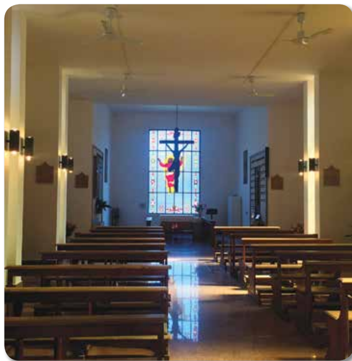
Cimitero - cappella