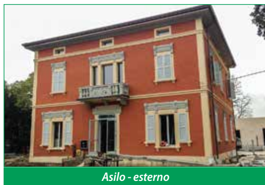
Asilo - esterno

E' possibile votare fino al 15 dicembre online dal sito www.comune.pievedicento.bo.it oppure all'URP tramite apposita scheda da inserire nell'urna. Il risultato del voto si saprà entro la fine dell'anno. ■