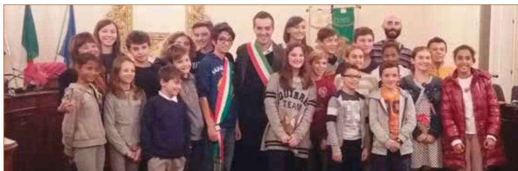
Insediamento Consiglio Comunale dei Ragazzi 2016

Un primo esempio di ciò è la mattinata di incontri col Sindaco, in Sala del Consiglio, delle classi V della primaria che si è tenuta il 29 novembre. ■