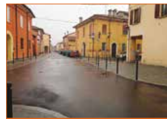
Via Matteotti - Via San Carlo

e marciapiedi più belli e più sicuri, soprattutto per pedoni e ciclisti. ■