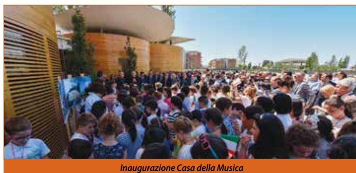
Inaugurazione Casa della Musica