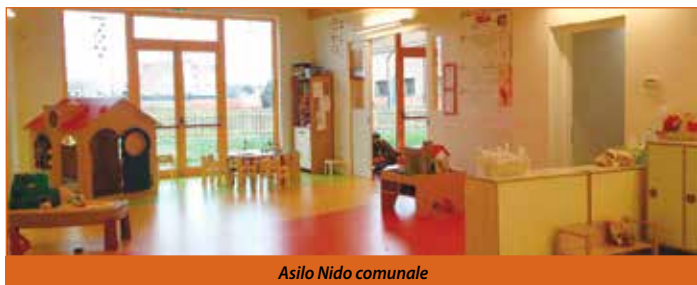
Asilo Nido comunale