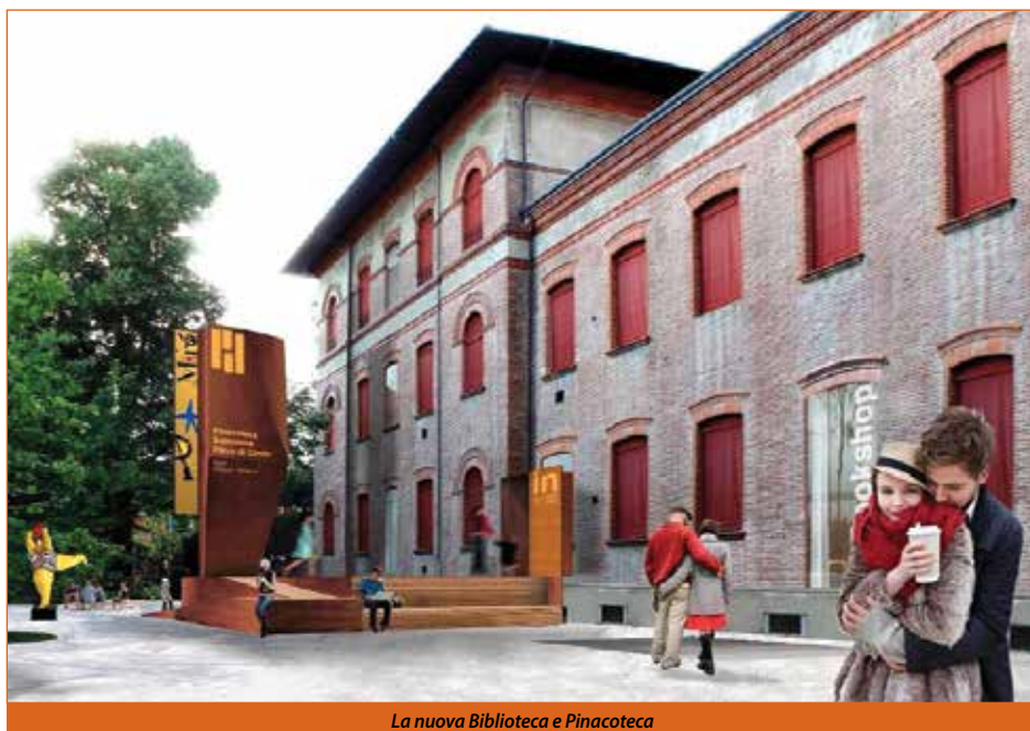
La nuova Biblioteca e Pinacoteca

Parallelamente partiranno i lavori di sistemazione delle aree esterne nei pressi di via Rizzoli e delle ex scuole elementari: