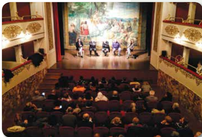
Progetto Pace - Convegno