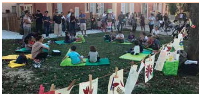
Lab 63

Per i piccolissimi e i loro genitori invece sarà attivo il corso di massaggio infantile e una proposta a loro espressamente dedicata che li coinvolgerà, tutte le settimane, in momenti di interazione e lettura ad alta voce con educatrici di nido qualificate.