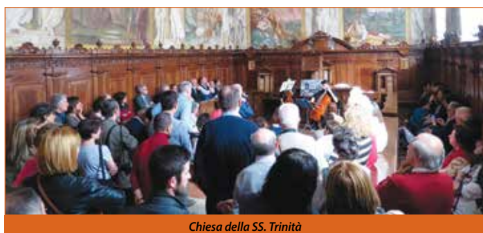
Chiesa della SS. Trinità