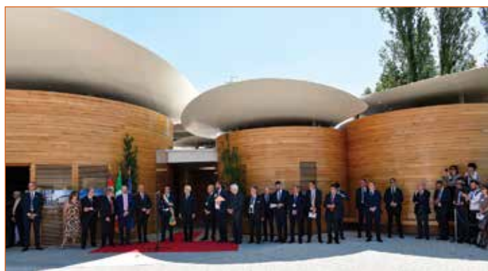
Inaugurazione Casa della Musica