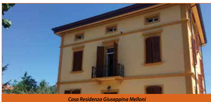
Casa Residenza Giuseppina Melloni