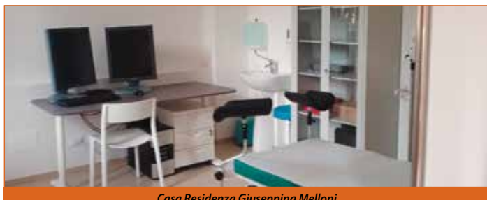
Casa Residenza Giuseppina Melloni

Ai principali risultati del 2017 si aggiungono le tante attività e iniziative che le Associazioni attive - a cui va il nostro più sentito ringraziamento - propongono e promuovono ogni anno a Pieve, e che contribuiscono a fare di Pieve una comunità viva e sempre dinamica. ■