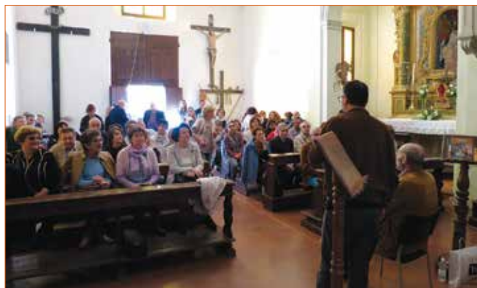
Weekend Pieve città d'arte e cultura

Nel corso del 2017 sono state riaperte alla comunità la Chiesa della Santissima Trinità e Porta Cento . Ma non solo. Da quest'anno a Pieve è attivo un gruppo FAI che si è già contraddistinto, oltre che per l'apertura della Chiesa della Ss. Trinità ogni quarta domenica del mese con visite guidate gratuite, per la co-realizzazione di importanti iniziative quali le giornate dedicate all'arte e alla cultura di marzo e la Giornata FAI d'Autunno dedicata alla musica. Ad oggi, da gennaio a ottobre, i nostri Musei hanno visto la presenza di oltre 2000 visitatori. Infine, nel corso del 2017, Pieve è stata inserita nella Card dei Musei dell'area metropolitana bolognese e sempre a Pieve l'Amministrazione ha promosso oltre cento eventi all'interno della stagione teatrale e della stagione estiva , che per il primo anno a questa parte è stata estesa anche alla Piazza della Rocca.