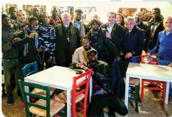
Progetto Pace - Inaugurazione