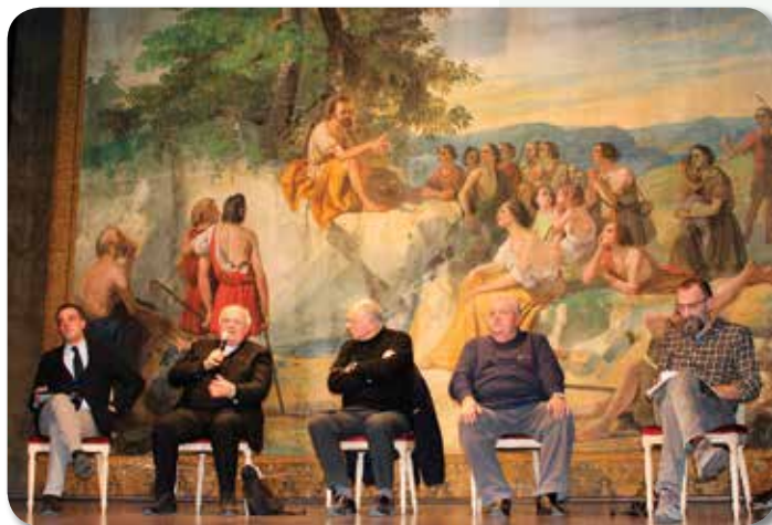
Progetto Pace - Convegno