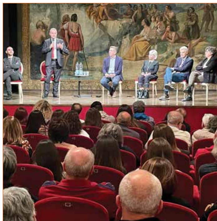
L'incontro "Facciamo il punto sulla sanità pubblica - PNRR, Emergenza/Urgenza, Case della Comunità: come si traducono nel nostro territorio?"